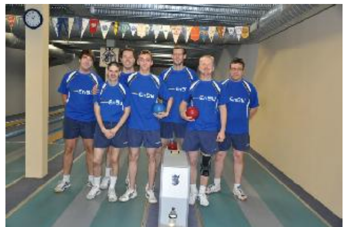
SG EBT 1952 Berlin