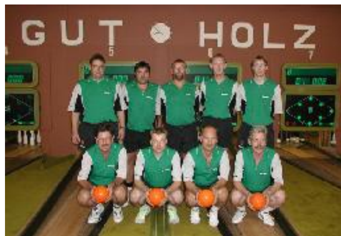
SG Mohnhof Neuengamme