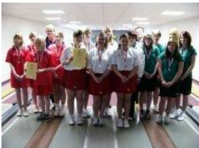
Gruppenfoto Jugend A weiblich.