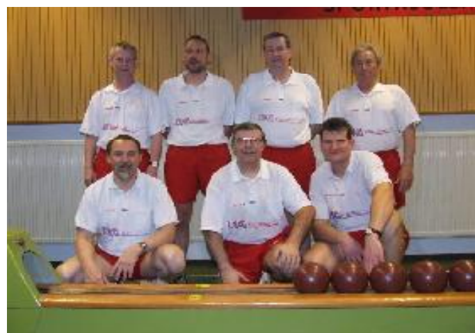
Absteiger TSV Motor Adlershof Berlin