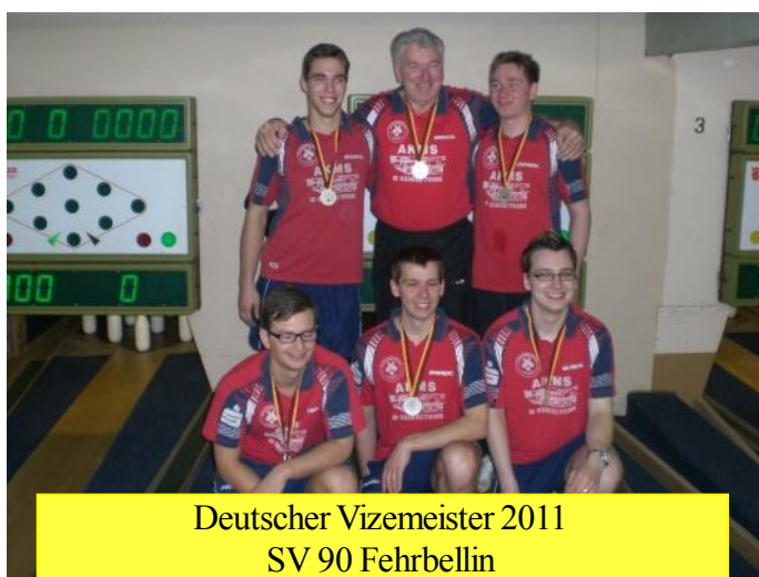
Deutscher Vizemeister 2011 SV 90 Fehrbellin