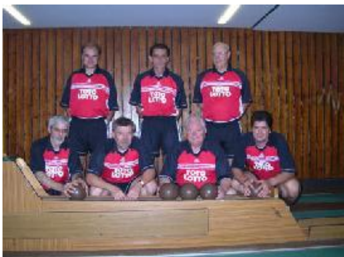
SG Springe 52/Rot-Gelb Sarstedt