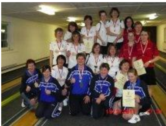
Gruppenbild Finale LLD.