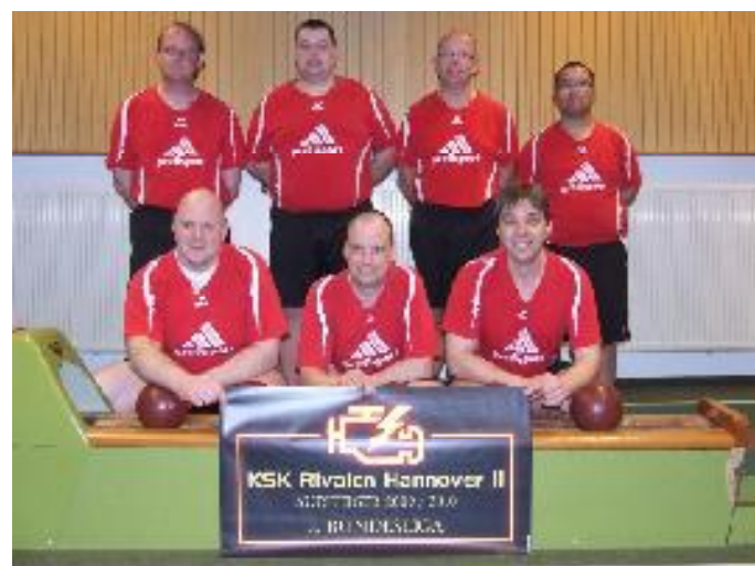
KSK Rivalen 2 Hannover