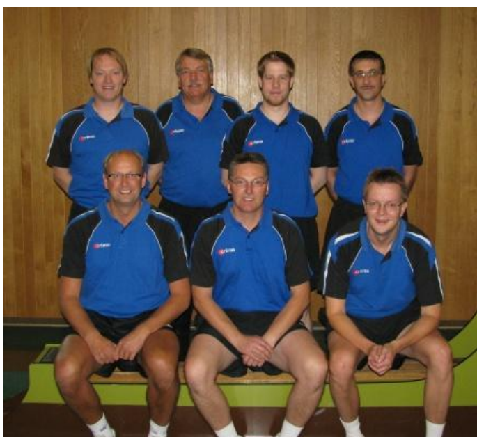
Meister 2011 LTS Bremerhaven