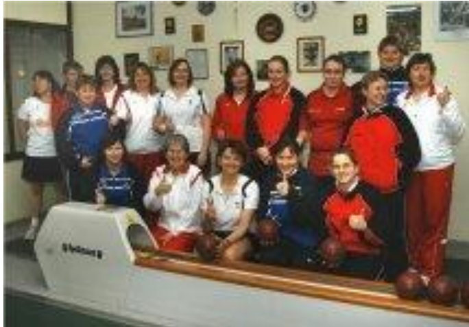
Gruppenbild im Vorletzten Turnier der Landesmeisterschaft 2011 in Altdöbern