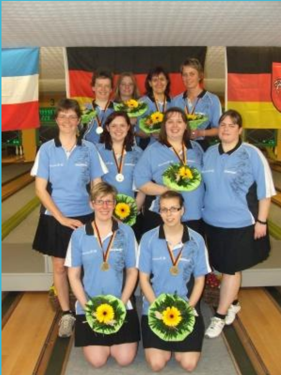
SG LTS/KCN Bremerhaven