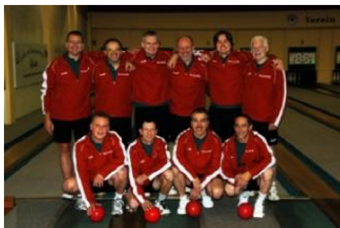
KSK Concordia Lübeck