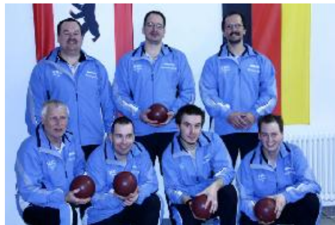
Meister und Aufsteiger in die 1. Bundesliga SG VKC/Germanina/FE 27 Spandau