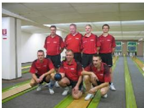
Absteiger Motor Hennigsdorf