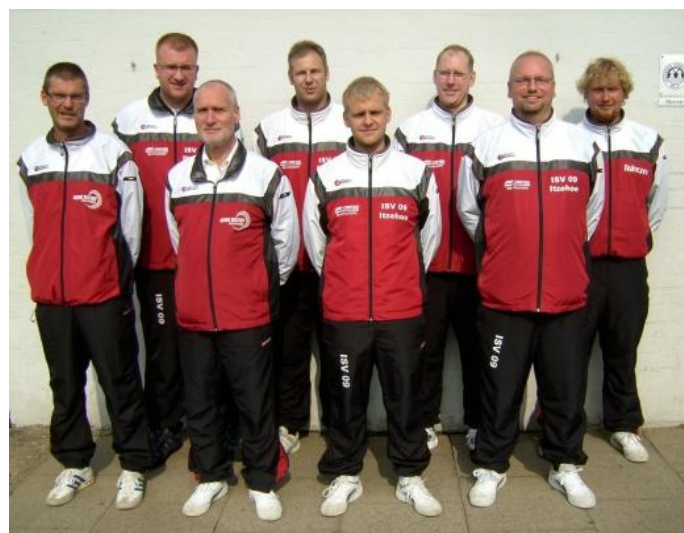
Die VISK-Bundesligakegler kämpfen um den Klassenerhalt.