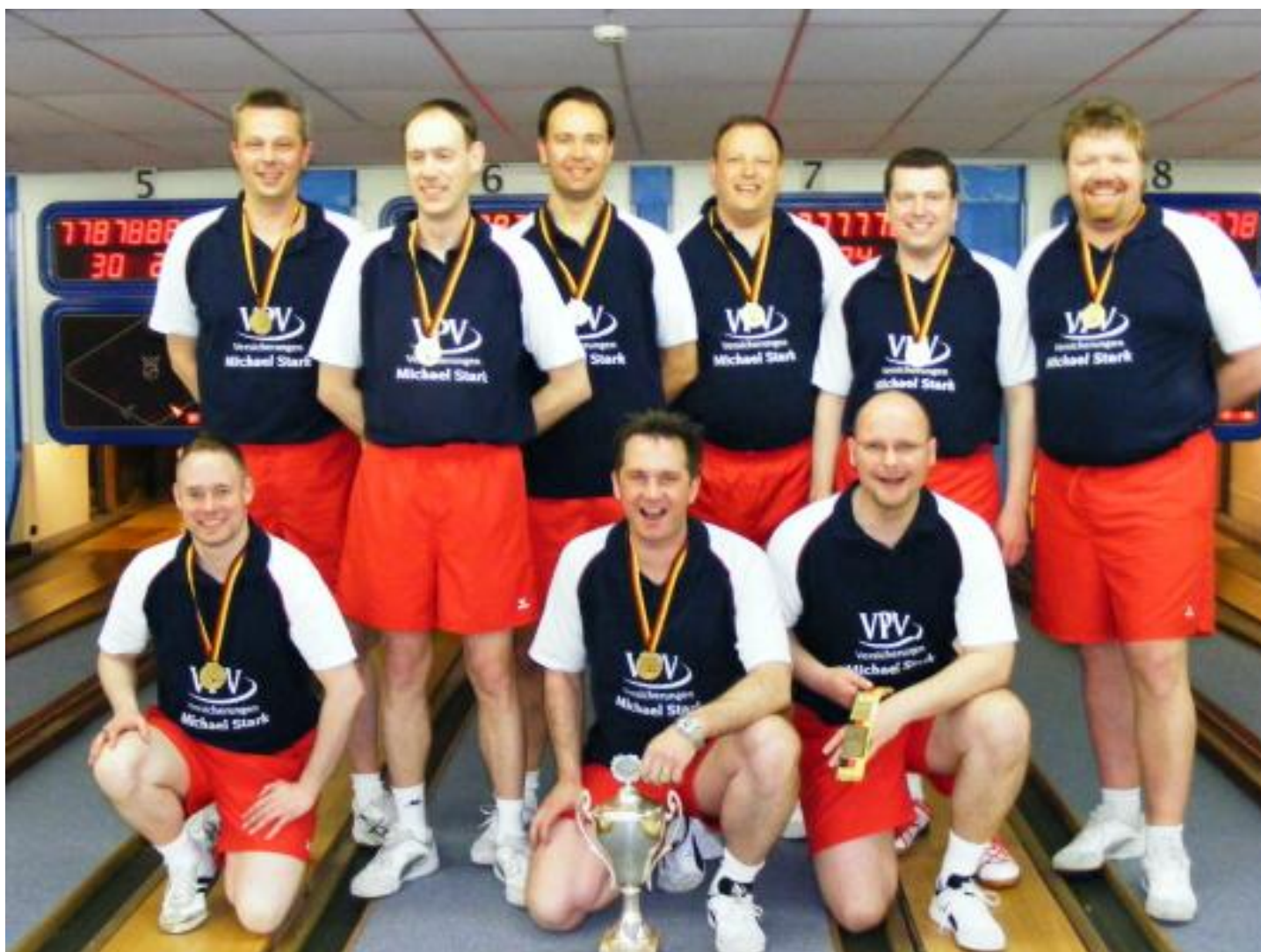
Deutscher Meister 2011 die SG ETV/Phönix Kiel