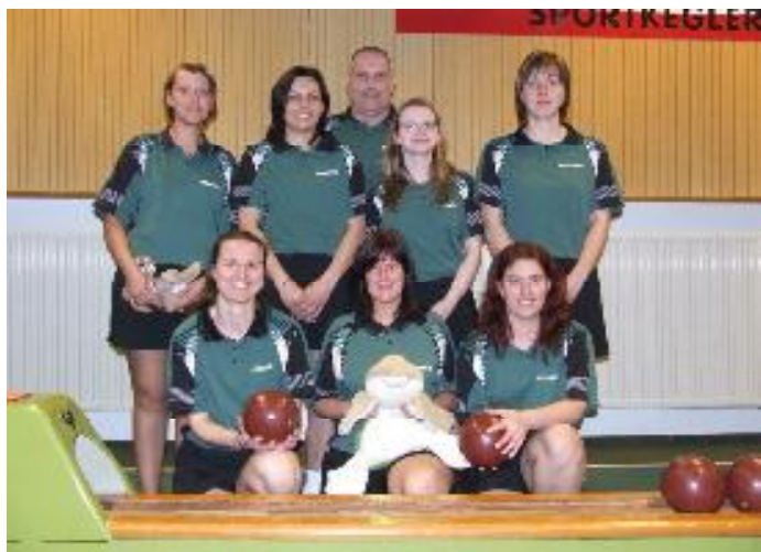
Die SG Süplingen/Haldensleben belegte am Ende der Saison 2010/2011 den 10. Rang.