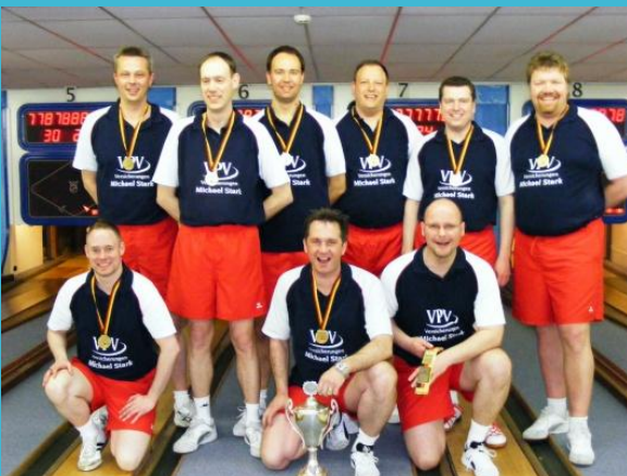
SG ETV/Phönix Kiel