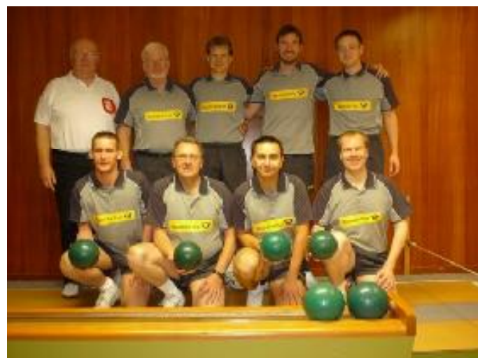
SG F/S Lüneburg