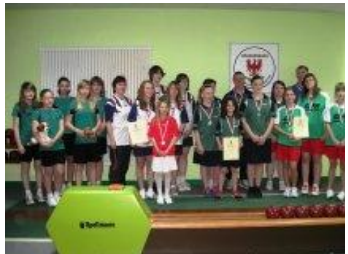
Gruppenfoto Jugend B weiblich.