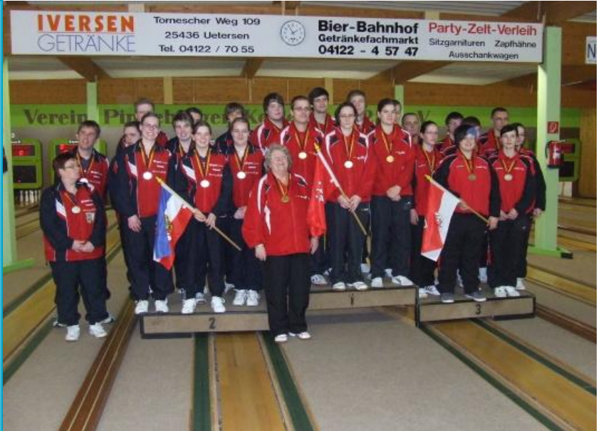
Ländervergleichsspiele der Juniorinnen und Junioren 2011 in Pinneberg 2. Schleswig-Holstein, 1. Hamburg, 3. Brandenburg