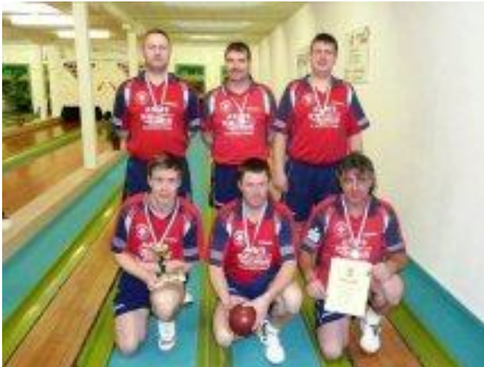
Landesmeister SV 90 Fehrbellin II.