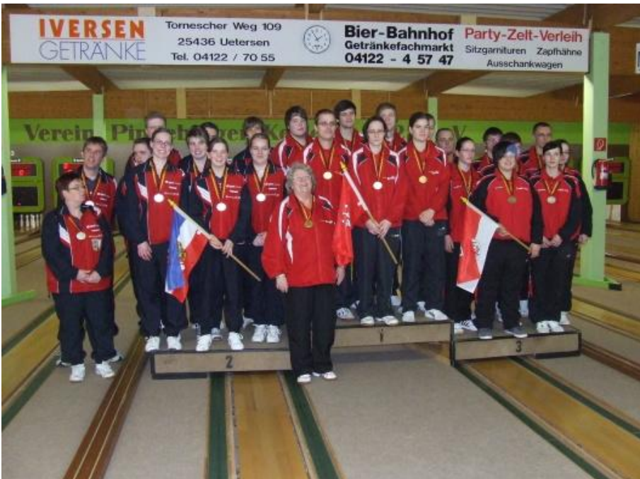
2. Schleswig-Holstein, 1. Hamburg, 3. Brandenburg