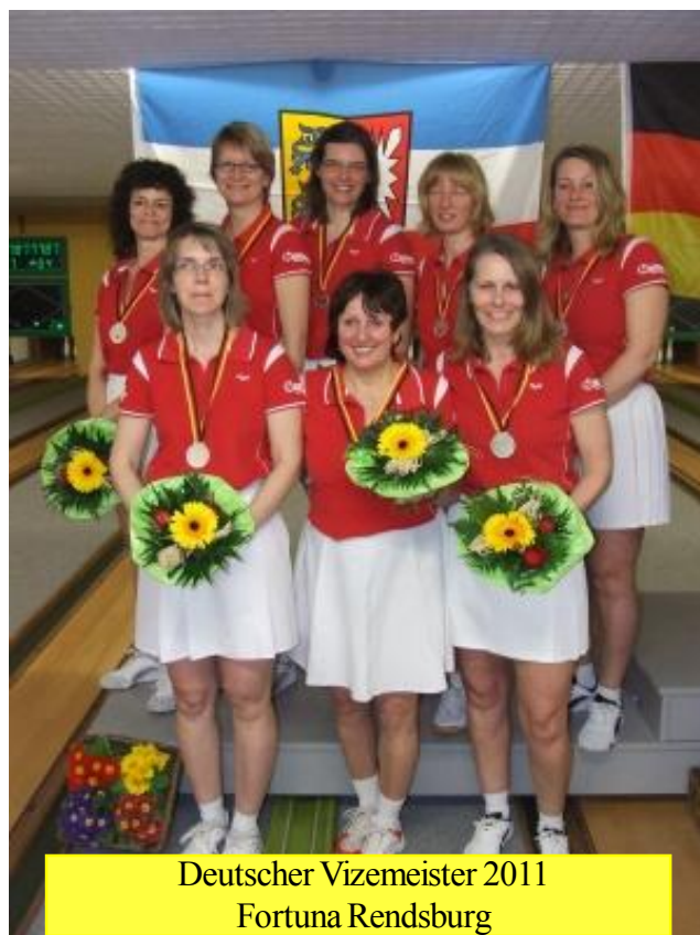
Deutscher Vizemeister 2011 Fortuna Rendsburg

Der fünfte Doppelspieltag in Pinneberg verlief allerdings nicht wie erhofft, doch nach einem 1:2 gegen Flotte Neun Peine wurde gegen DKC Hannover mit 3.0 gewonnen und damit der Grundstein am Endspieltag gegen den haushohen Favoriten Fortuna Rendsburg um den Titel spielen zu können, gelegt. (Fritz Bötjer)