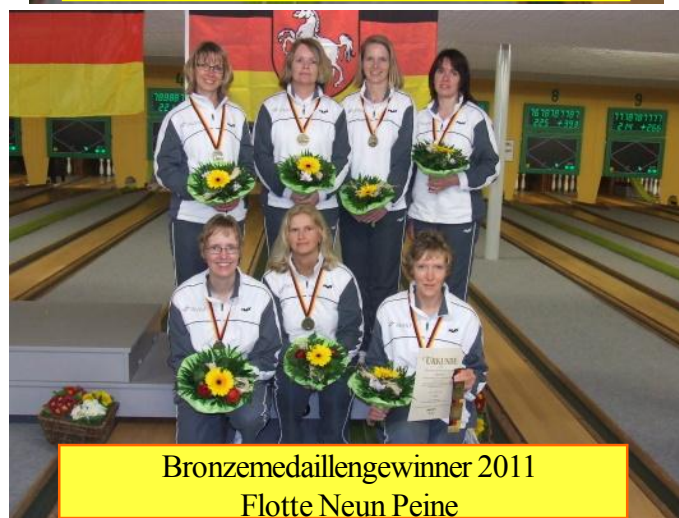
Bronzemedailleengewinner 2011 Flotte Neun Peine