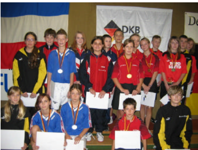
Beobachtungskader B-Jugend 2008.