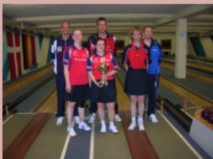
Europacup 2008 in Fredericia