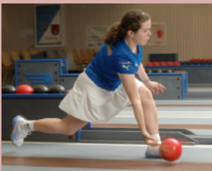
Start der Bundesligasaison 2008 - 2009