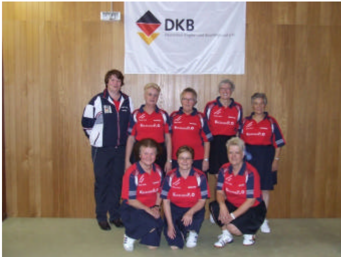
Damen-A Nationalmannschaft 2008