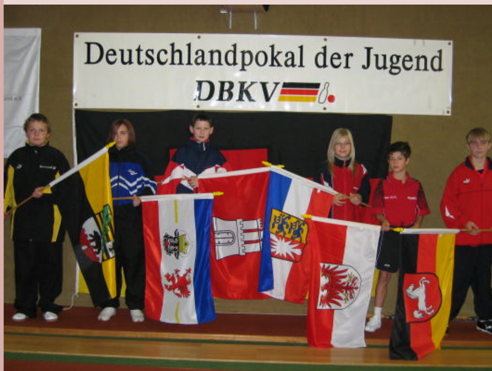
Deutschlandpokal der B-Jugend in Lammetal