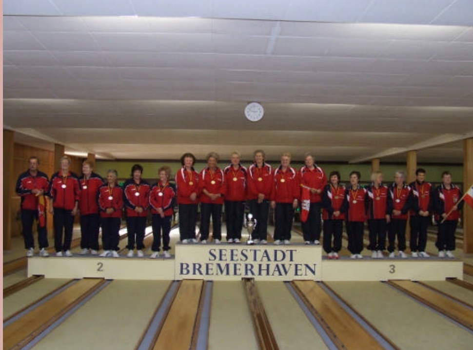
Ländervergleichsspiele Damen-A und Herren-A in Bremerhaven