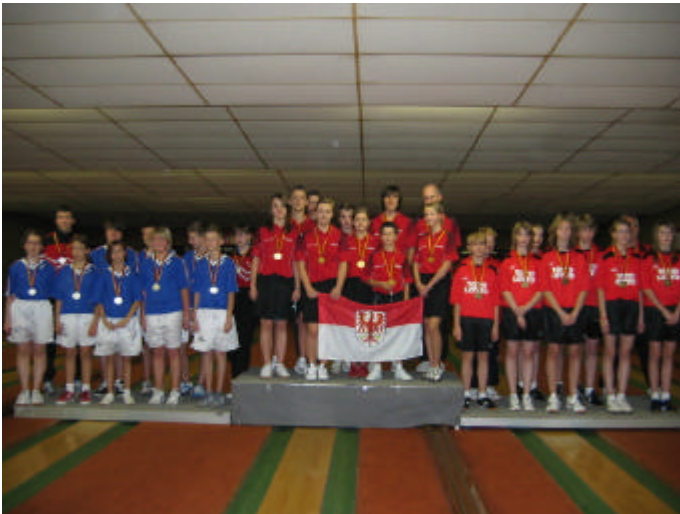
Die Sieger und Platzierten.