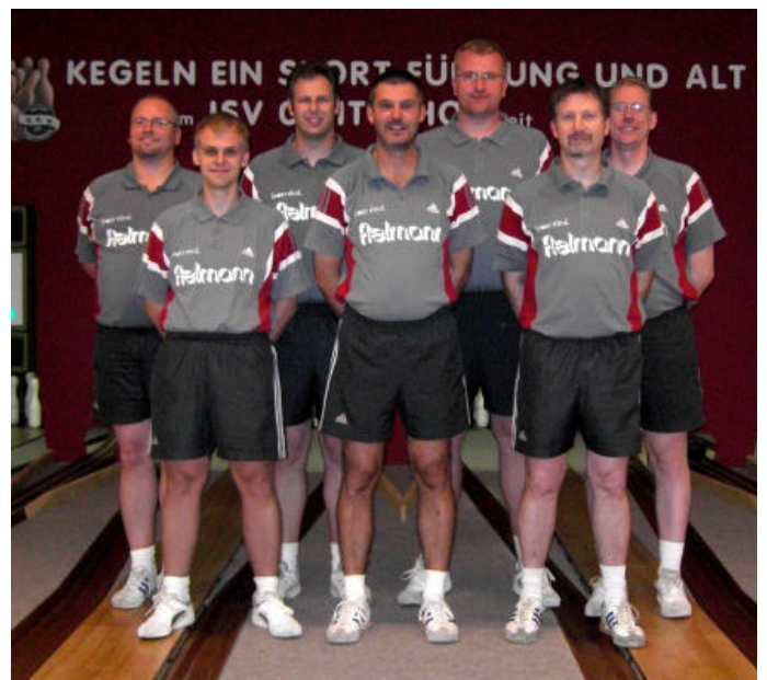
Die 1. Mannschaft des ISV 09 Itzehoe.