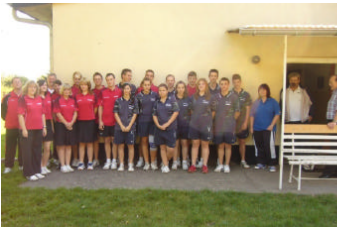
Gruppenbild - 17. Ländervergleich der A-Jugend Brandenburg -den LFV Berlin

Die nächsten Aufeinandertreffen dieser beiden Teams werden vom 08. bis 10. November in Bad Segeberg beim Deutschlandpokal sein. Es bleibt zu hoffen, dass die Brandenburger Jugendlichen sich dort mit einem anderen Gesicht präsentieren können, um wieder eine der begehrten Medaillen in die Mark zu holen.