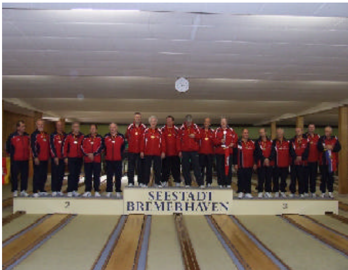
Herren-A von links: 2. Niedersachsen, 1. Hamburg und 3. Schleswig-Holstein.