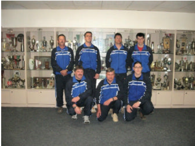
KSV Altdöbern 1992 mit einem neuen Hallenbahnrekord, als Landesliga Aufsteiger.