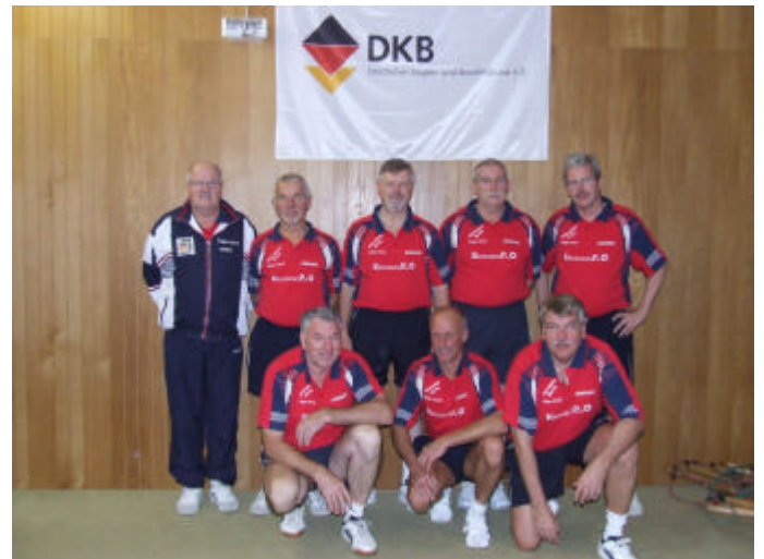
Herren-A Nationalmannschaft 2008