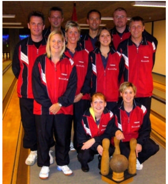
Bericht und Foto (1): Guido Schümann

„Ich bin mit unserer Mannschafts- und auch meiner persönlichen Leistung sehr zufrieden“, so das positive Fazit des Ausnahmeathleten und Nationalspielers Nowak. „Die eindeutigen Erfolge taten der Stimmung beim gemeinschaftlichen Beisammensein überhaupt keinen Abbruch. Schade, dass die nächste Begegnung zwischen den beiden Verbänden erst im Jahre 2010 stattfindet.“