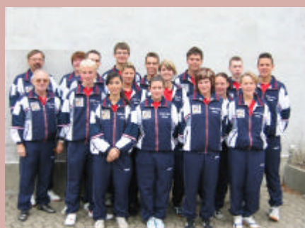
Jugendländerspiel Dänemark - Deutschland