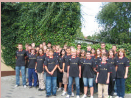
Sichtungslehrgang Jugendnationalkader in Bremerhaven