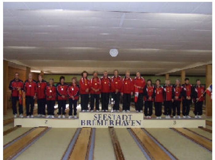
Damen-A von links: 2. Niedersachsen, 1. Hamburg und 3. Schleswig-Holstein.