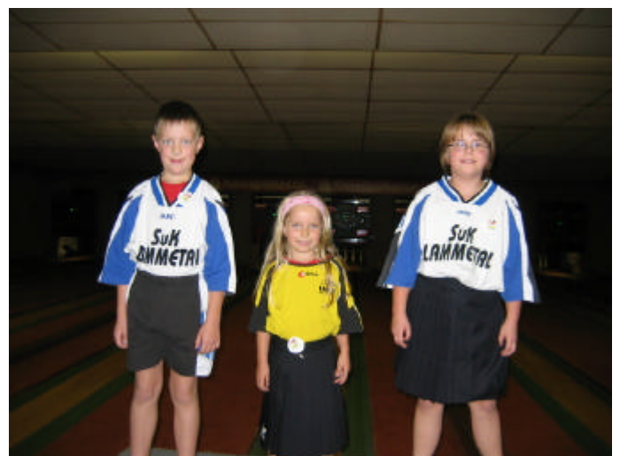
Medaillenkinder aus Lammetal.