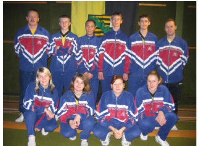
Die Weihnachtslied-Singers-LV Sachsen-Anhalt.