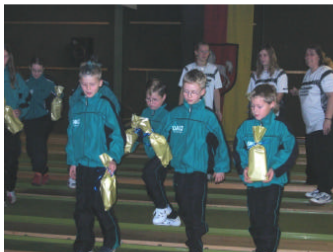
Ehrenpreisübergabe – Jugend des VNK