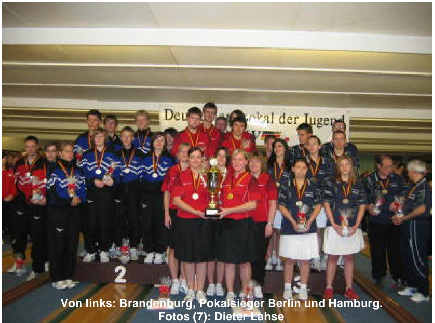
Von links: Brandenburg, Pokalsieger Berlin und Hamburg.

Letztlich konnten sich Berlin und Brandenburg mit je 15 Punkten vor Hamburg (11) und Niedersachsen (10) durchsetzen. In den Spielen um Platz 5 – 8 gab es dann folgende Ergebnisse: Schleswig-Holstein (14), Bremen (13), Mecklenburg-Vorpommern (12) und Sachsen-Anhalt (11).