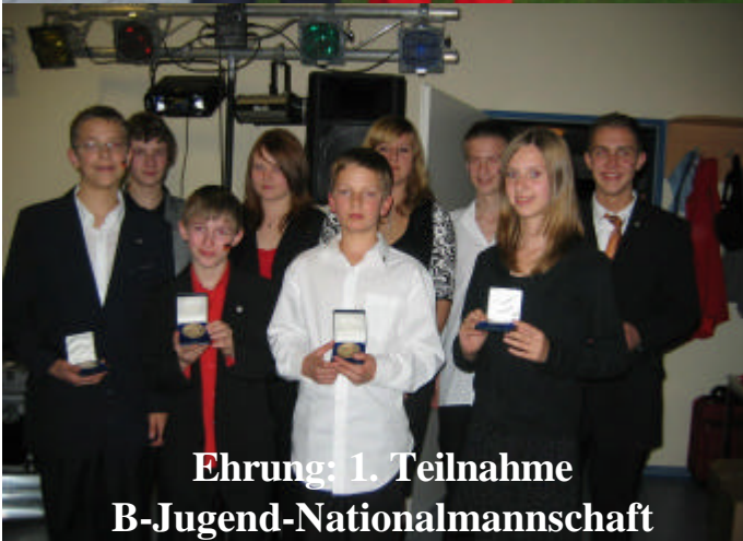
Ehrung: 1. Teilnahme B-Jugend-Nationalmannschaft