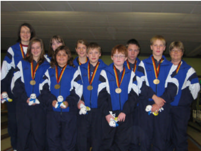
3. Platz Schleswig-Holstein