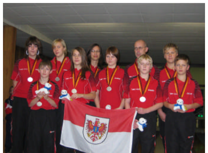
2. Platz Brandenburg