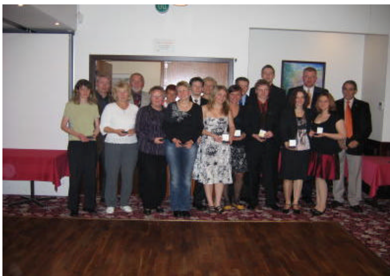
Ehrungen für den 1. internationalen Einsatz.