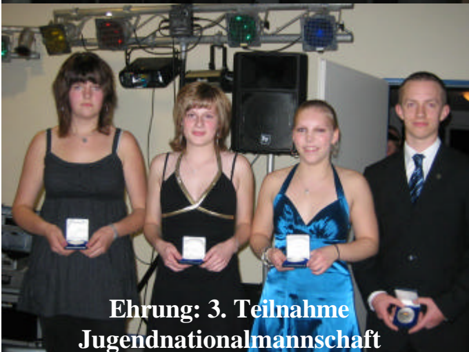
Ehrung: 3. Teilnahme Jugendnationalmannschaft