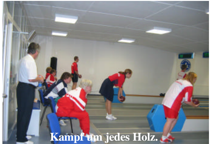
Kampf um jedes Holz.