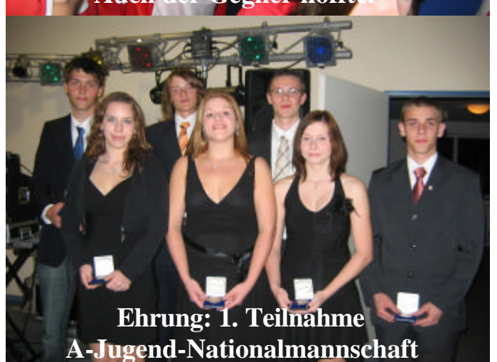
Ehrung: 1. Teilnahme A-Jugend-Nationalmannschaft