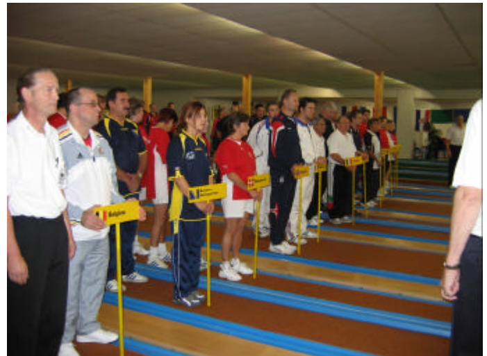
Die teilnehmenden Nationen