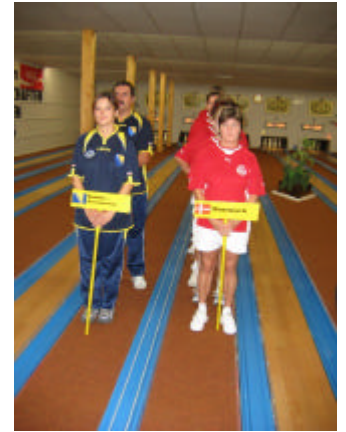
Bosnien und Herzegowina und Dänemark