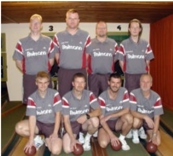
ISV 09 Itzehoe