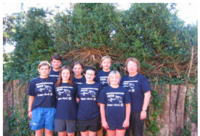
Weibliche B-Jugend :