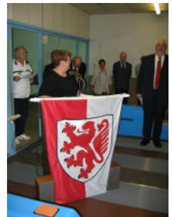
Die Bürgermeisterin der Stadt Braunschweig Inge Kükelhan