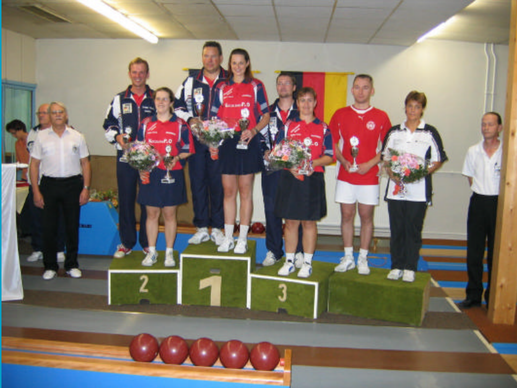
Bohle: Die Europameister und Platzierten bei den 1. Europameisterschaften Nine-Pin-Triple (Dreibahnen) in Braunschweig.