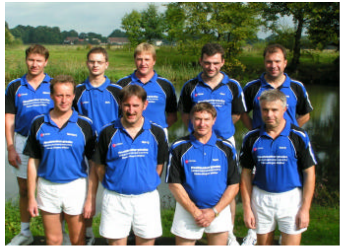
SVL Seedorf von 1919